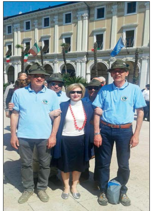
(nella foto la nostra Madrina Astrid con capogruppo e tesoriere in occasione delle cerimonie del 2 Giugno)

Anche in questi ultimi mesi non sono mancate partecipazioni, assistenze, collaborazioni che ci hanno visto impegnati. A febbraio abbiamo fattivamente collaborato alla 6° Magnifica Salodium, Trail organizzato da Garda Running, a marzo abbiamo preparato il tradizionale spiedo alla Casa di Riposo, ad aprile abbiamo collaborato alla realizzazione della gara trail BVG, partecipato alle cerimonie in occasione della presenza del Consiglio Direttivo Nazionale a Gardone Riviera e a quelle per il XXV Aprile, a maggio eravamo presenti all'abituale festa degli Autieri, abbiamo sostenuto l'AIIRC in occasione della vendita delle Azalee benefiche e montato la tenda per la pesca estiva della Caritas. A giugno abbiamo partecipato alla cerimonia per la festa della Repubblica (2 giugno), fornito assistenza ai Runners Salò per la Run for Telethon, collaborato presso l'ANFFAS di Fasano per la festa estiva e prestato assistenza alla Covesco per la Camminata Ecologica del Garda.